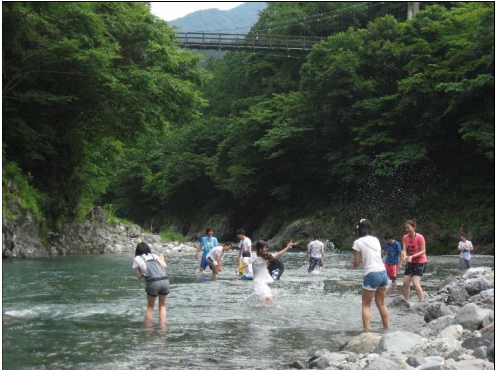
DISFRUTANDO del tiempo libre en la naturaleza, las niñas juegan en el río Tama sin temor a mojarse. Que se diviertan, con un poquito de cuidado para no molestar a los demás...

El Terrícola El Terrícola S.A., Tokio Editor Irresponsable: Yo Redactor: Yo Corresponsal: Yo Diseño Gráfico: Yo Colaborador: Yo Publicación irregular Menos de 10 ejemplares © 2012 El Terrícola S.A.